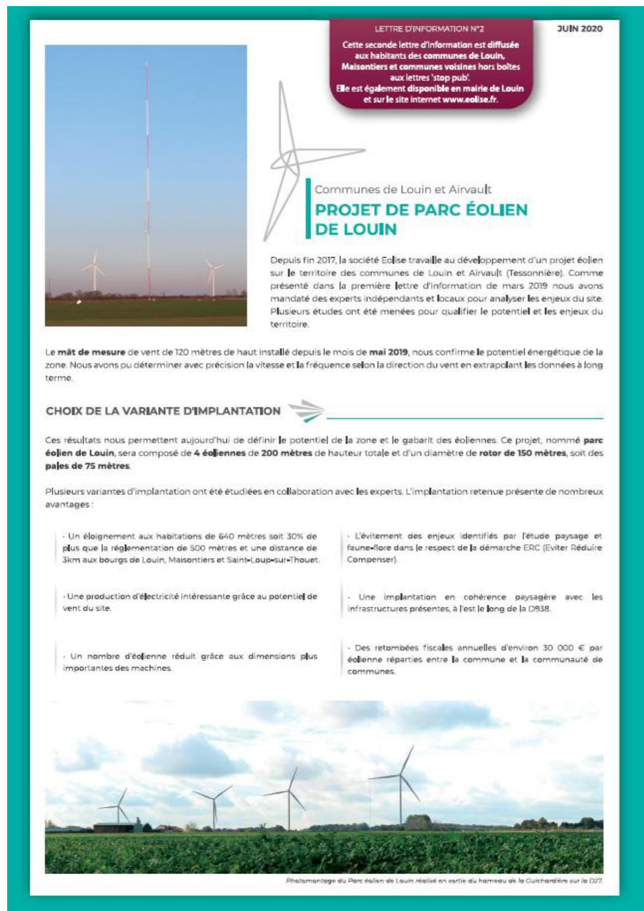
Figure 9 Extrait de la lettre d'information n°2 – Juin 2020